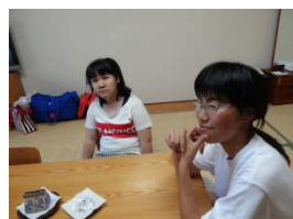
<部屋でゆったりと>