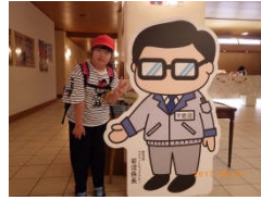
<岩沼係長さん登場！>